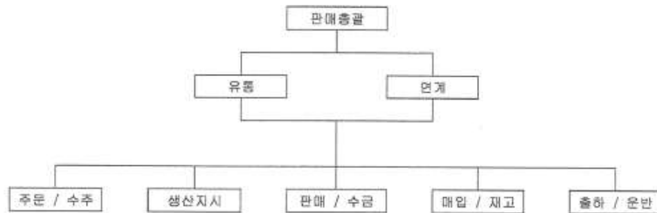
- 판 매 조 직 도 -